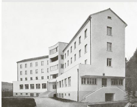
1935: Neubau des Blinden-Altersheims

1906 wurde der Luzerner Blinden-Fürsorge-Verein gegründet. Am 24. April 1919 konnte in der Gemeinde Horw die Liegenschaft «Merkur» als künftiger Standort für das Blindenheim und die Blindenwerkstätten käuflich erworben werden. Die Gebäulichkeiten behergten eine Institution für fremdsprachige Schüler und mussten entsprechend umgebaut werden.